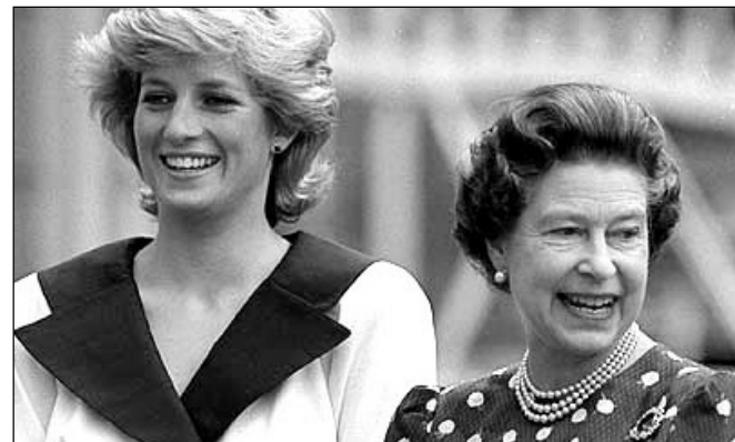
31 août 2007 :: que me reste-t-il de Lady Diana ?

En 1997, les français dans une grande majorité je pense, ont été frappés par la mort tragique de cette « princesse des cœurs » et je me souviens que cela s'est passé un jour avant l'arrivée de